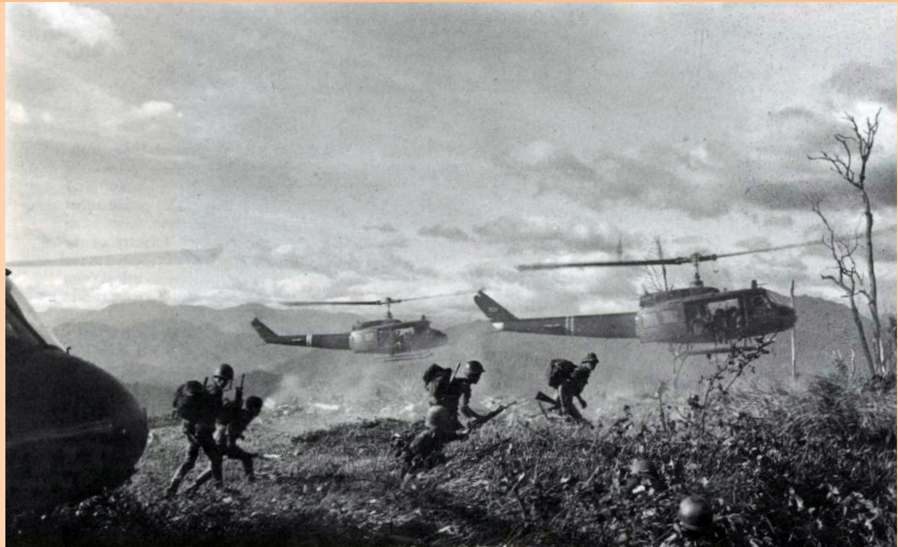
Des soldats du 1er bataillon du 6e régiment de l'armée vietnamienne (ARVN) sont transportés par avion jusqu'à la zone d'atterrissage de Kala, au nord-est de Khâm Đức, au Viêt Nam, par des UH-1H Hueys de l'armée américaine lors de l'opération Elk Canyon, le 12 juillet 1970.

Étudiant à la Maîtrise en Science Politique à l'Université de Montréal. Ses intérêts de recherche tournent principalement autour de la région du Sud-Est de l'Asie, plus précisément sur le tourisme dans la région ainsi que sur l'influence du sport dans la politique régionale.